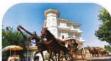
Îles des Princesses + Déjeuner