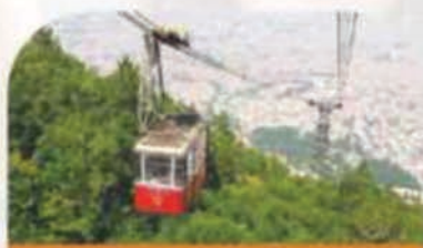
Bursa avec déjeuner