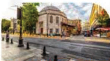
Visite guidée d'une journée à Istanbul + Déjeuner